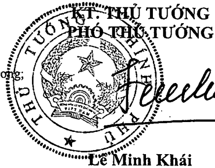
Lê Minh Khái